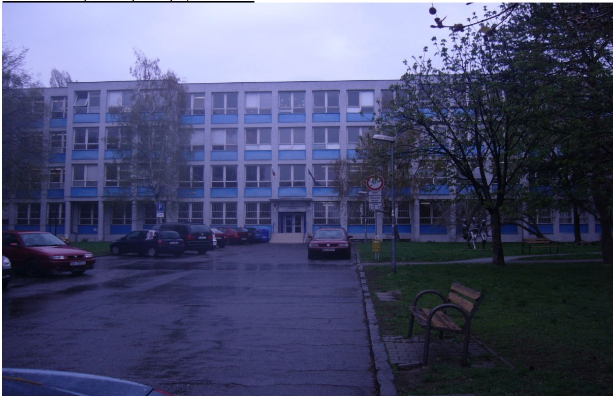
budova školy na Skalickej 1, s.č.1143